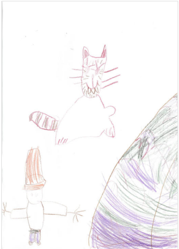
Pettersson und Findus gemalt von Sidra und Lurin

(Standortleitung der Inklusiven KiTa St. Josef)