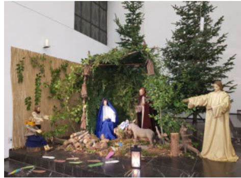
unsere Krippe in der Fronleichnamskirche 2018

Damit sich auch die Kleinen bei uns im Gottesdienst wohl fühlen, wurde im Pfarreirat beschlossen, eine Malecke einzurichten. Im Dezember beginnen wir damit und stellen einen kleinen Tisch mit Stühlen, Stiften und Papier in das rechte Seitenschiff der Kirche. So können Kinder sich beschäftigen und Eltern haben den Gottesdienst und ihre Kinder im Blick.